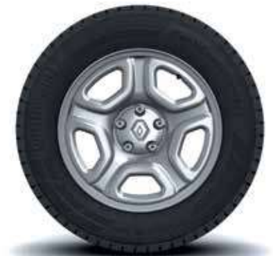
rin 16" de lámina