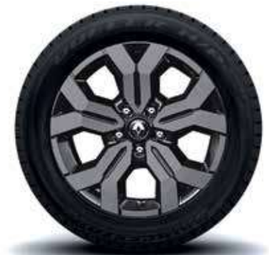
rin 17" aluminio - diamantados