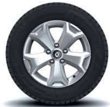
rin 16" aluminio